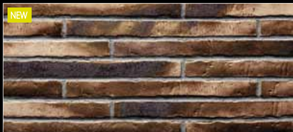
NEW Riegel 490 x 40 x 14 mm

455 braun-blau ☹ < 3 % DIN EN 14411, Gr. AI b