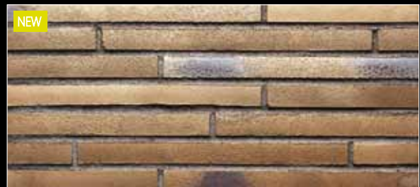
NEW Riegel 490 x 40 x 14 mm

451 gold-braun ☹ < 3 % DIN EN 14411, Gr. AI b