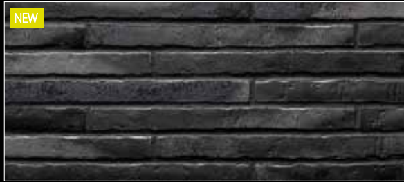
NEW Riegel 490 x 40 x 14 mm

453 silber-schwarz ☹ < 6 % DIN EN 14411, Gr. AII b -IerI