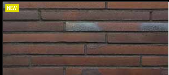
NEW Riegel 490 x 40 x 14 mm

452 silber-grau ☹ < 3 % DIN EN 14411, Gr. AI b