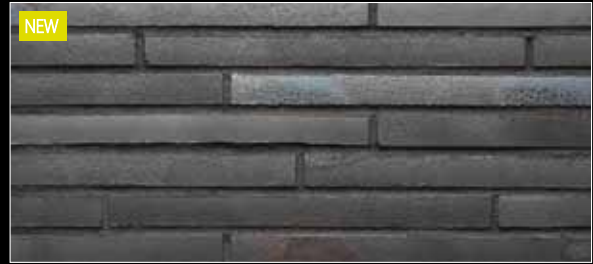
NEW Riegel 490 x 40 x 14 mm

453 silber-schwarz ☹ < 6 % DIN EN 14411, Gr. AII b -IerI