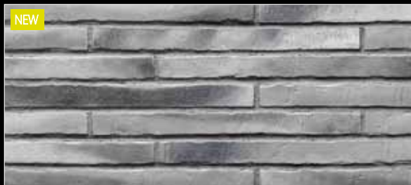
NEW Riegel 490 x 40 x 14 mm

456 schwarz-blau ☹ < 6 % DIN EN 14411, Gr. AII b -IerI