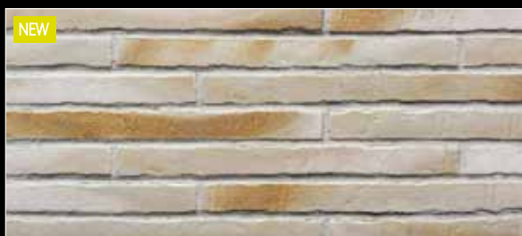
NEW Riegel 490 x 40 x 14 mm

454 creme-blau ☹ < 3 % DIN EN 14411, Gr. AI b